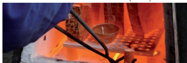
Keramikmuseum Höhr-Grenzhausen (18.9.)

Durch die Musikgeschichte mit dem Musikverein Otterbach: Die Verbandsgemeinde Otterbach aus der Pfalz präsentiert sich mit dem Musikverein Otterbach. Zwischen den Auftritten erfahren die Besucher Wissenswertes über die Region. 11.00 + 14.00 + 15.00 Uhr: Musikverein Otterbach 16.15 Uhr: Der Ewige Soldat