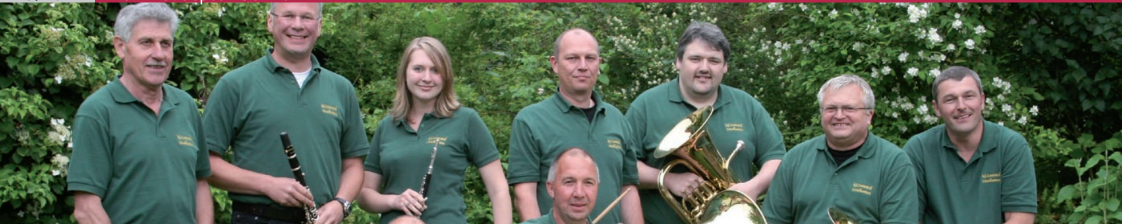
Lesuratal Musikanten (21.9.)